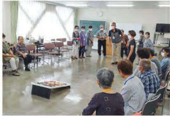
▲流山北地区社会福祉協議会の「世代交流会」。コーンホールはアメリカ発祥のパーティゲームでピンバグ(布袋に豆や穀物を詰めたボール)をボードの穴に投げて得点を競うシニアにもやさしいスポーツ。地区社協活動にも赤い羽根募金を活用されています。