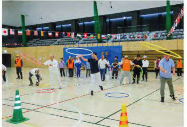
▲キッコーマンアリーナで開催された流山市老人クラブ連合会の「大運動会」。老人クラブの事業活動にも赤い羽根共同募金が活用されています。