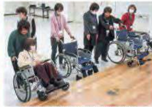
▲介護者との接し方や車いすの取り扱いなどを学べます。

ボランティアセンター窓口へ要請したいものです。活動を希望される方はボランティアセンターまでご連絡ください。