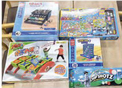
▲昨年末、障害者施設や児童養護施設、子ども食堂などに歳末たすけあい募金の助成金をお届けしました。(生活介護事業所でないでで購入したボードゲーム)