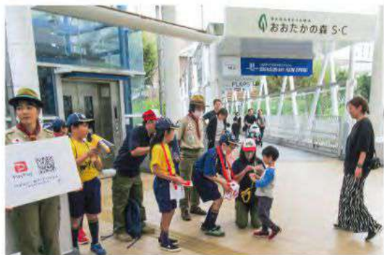
▲流山おおたかの森駅の自由通路で行った街頭募金。ボーイスカウト・ガールスカウトの皆さんのご協力によりたくさんの募金が寄せられました。