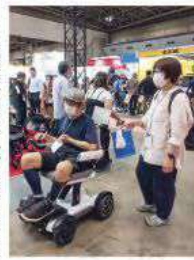
▶電動車いすお試し中。このあと実際に乗った方は、生活の質が格段に向上しました。

ですが、昨年は、東京・晴海の東京ビッグサイトで開催された「国際福祉機器展」に電車を乗り継いで見に行くことを目標にリハビリに励み、職員の付き添い・介助のもとで実現させました。 展示会では、最新のリハビリ機器や、様々なタイプの電動車いす、福祉車両などを見て触って試乗して、皆さん大興奮！ここで皆さんが選んだ下肢の機能を強化するリハビリ機器が、今月デイサービスに導入されました。 また、季節感のある行事の企画や、ボランティアなど多くの地域住民との交流機会も