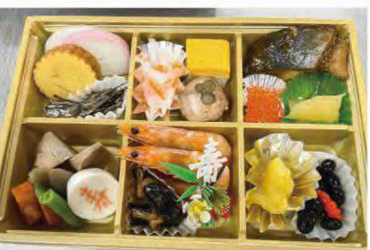
▲地域歳末たすけあいの一環として、流山あけぼの会様にご協力いただき、市の配食サービスを受けているお一人暮らしの方を対象に、おせち料理をお届けしました。(歳末たすけあい募金が活用されています。)

人形劇ピッコロ 流山落語同好会 個人ボランティアの皆さま 流山市社会福祉協議会 評議員の皆さま