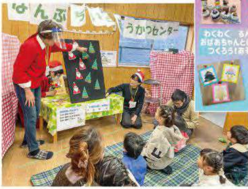
▲おばあちゃんたち手作りのパネルシアターに夢中になる園児たち。 ▼手作りのおもちゃや小物、子どもたちの喜ぶ笑顔を思い浮かべ、一生懸命作ってます!(「火・木会」と、南部包括のボランティアの皆さん)

▶かわいい小物やおもちゃはおばあちゃんたちのお手製。親子一緒に、みんなで「ケーキ」を作って遊びました!