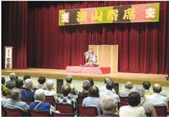
▲流山市生涯学習センターで開催された流山落語同好会による赤い羽根共同募金チャリティー「流山寄席」。歳末たすけあい募金のチャリティー寄席の開催時にもご協力いただき、設置いただいた募金箱にはたくさんの募金が寄せられました。