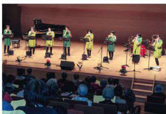
▲スタートおおたかの森ホールで開催された小さな小さな音楽会主催の「オカリナフェスティバル」。赤い羽根共同募金のチャリティ募金箱を設置していただき、たくさんの募金をお寄せいただきました。