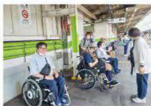
▲武蔵野線のホームにて。「いざ、ビッグサイトへ！」

また、季節感のある行事の企画や、ボランティアなど多くの地域住民との交流機会も 展示会では、最新のリハビリ機器や、様々なタイプの電動車いす、福祉車両などを見て触って試乗して、皆さん大興奮！ここで皆さんが選んだ下肢の機能を強化するリハビリ機器が、今月デイサービスに導入されました。 また、季節感のある行事の企画や、ボランティアなど多くの地域住民との交流機会も