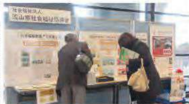
▲災害ボランティアや被災地支援の情報をパネル展示で紹介