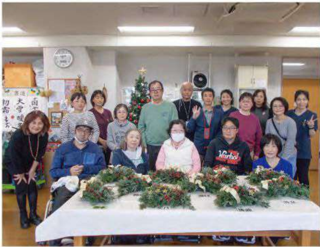
▶ボランティアの講師の方の指導でクリスマスリースを制作しました。みんなで「ハイ、チーズ！」

流山市社会福祉協議会では、平和台にある流山市ケアセンターの2階で、身体障がいの方のデイサービス（地域活動支援Ⅱ型）を運営しており、ご病気などによって障がいの認定を受けた方の社会参加とリハビリテーション（機能訓練や芸術文化活動を通じた作業療法）の機会を提供しています。 たとえば、理学療法士の指導で様々な器具や機械を用いて、一人一人のご病気や障害で動きにくくなっている体の機能を維持・回復できるように、定期的にリハビリテーションを行っています。 また、リハビリを兼ねて、フラワーアレンジメントや七宝焼きや木彫り、書道や音楽など様々な活動に専門家の協力を得て取り組んでいます。 栄養バランスを考慮した昼食やおやつを召し上がっていただくほか、利用者やスタッフが協力して簡単なおやつを作っています。 また、リハビリを兼ねて、定期的にリハビリテーションを行っています。 また、リハビリを兼ねて、フラワーアレンジメントや七宝焼きや木彫り、書道や音楽など様々な活動に専門家の協力を得て取り組んでいます。 栄養バランスを考慮した昼食やおやつを召し上がっていただくほか、利用者やスタッフが協力して簡単なおやつを作っています。 また、リハビリを兼ねて、定期的にリハビリテーションを行っています。