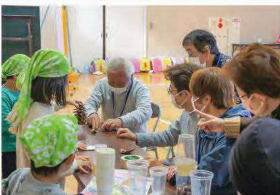
▲新川北部地区社会福祉協議会の「あつまれ西深井の森フェスティバル」。健康体操や児童作のどんぐりコマ、松ぼっくりのけん玉で老若男女を問わず交流を楽しみました。地域交流事業にも赤い羽根共同募金が活用されています。