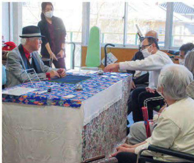
◀演芸ボランティア「珍幻影」さんのテーブルマジック。一回が出るかな？

ご利用・ご見学のお問い合わせは 流山市身体障害者 デイサービスセンター ☎04-7159-0505