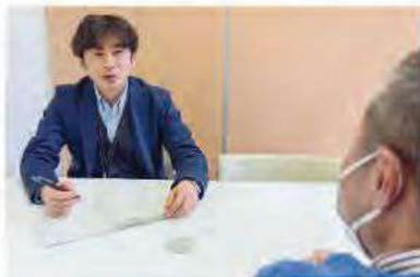
▲よりそいにお越しの際のご相談は、相談室にてお話をうかがいます。

▶イベント情報はチラシをお配りしたり、看板でもお知らせしています。最新のイベント情報はよりそいサポートセンターにお問合せください。