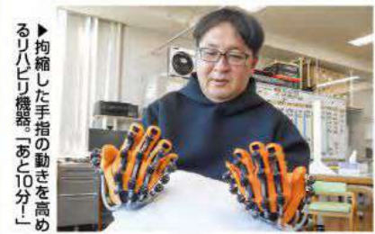
▶拘縮した手指の動きを高めるリハビリ機器「あと10分！」