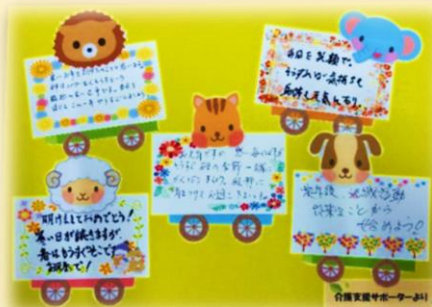
【お届けしたメッセージカード】