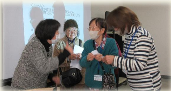
コミュニケーションをとりながらの靴下探し「靴下どこどこ」

現代社会の現状や諸問題を理解しながら、地域等との関わりあい方などを学びました。参加したサポーターからは「地域を含め進んで関わりを持つよう頑張る」「一人で生きていくより他と関わりながら生きることで自分に役立つ」など、自分なりのヒントを得た様子でした。