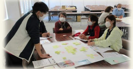
活動の活性化を図るため、担当者とサポーターとのグループワーク

事業内容のおさらいや、受入機関の受入前の環境整備などを再確認し、お互いが気持ちよく活動できるよう、それぞれの立場からの意見交換をしました。参加者からは「定期的開催し、たくさんの方とお話したい」との声が聞かれました。