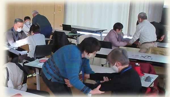
認知症ケア・生活支援技術の実践練習

認知症の中核症状や対応のポイント、介護を必要とする方への生活支援技術を実践を交えて学びました。「介助実技、福祉用具の使用方法が参考になった」「認知症の方への寄り添い方がわかりやすく勉強になった」と好評でした。