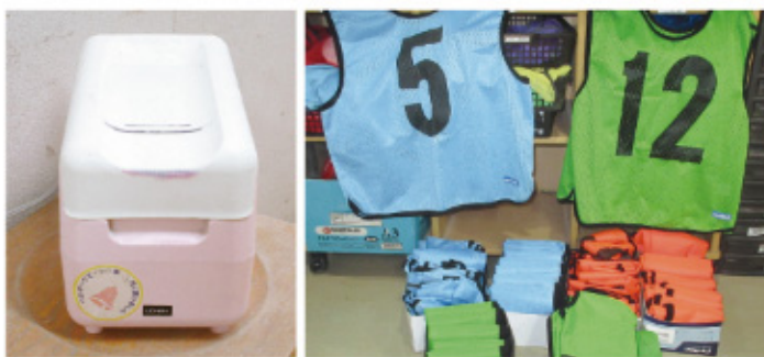
▲ベルマークを集めて購入した黒板拭きクリーナー・ピブス

本紙、200号で赤い羽根共同募金・歳末たすけあい募金にご協力いただいた方々を掲載いたしました。 同号発行後にも引き続きお力添えをいただき、令和5年度赤い羽根共同募金は、九百四十五万五千五百三円に、また、歳末たすけあい募金は、三百六十四万七千六百二十二円となりました。 前号発行後にご協力いただいた皆さんは次のとおりです(敬称略・順不同)。 ブスや黒板拭きクリーナーを数年前に購入しました。 このほかにも、リサイクル委員が古紙や牛乳パックの回収を行い、積極的に学校全体の美化に取り組んでいます。 ぜひ、皆さんもおうちボランティアで使用済み切手やベルマークを集めてみてください。「ボランティアポット」は市内の公共施設26か所に置かせていただいております。