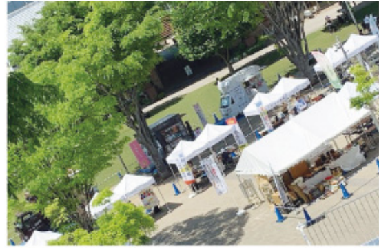
▶緑豊かな広場で行われた福祉展

イタコト展（株式会社i.ホールディングス主催）は、「誰かの心のこりを知ること、あなたの心のこりを言葉にすることで、あなたが前向きに生きるきっかけになる。」この様なコンセプトで開催されるイベントプロジェクトです。 4月26日から28日にかけて流山おおたかの森S・C森のまち広場で行われたこのイベントは、様々な福祉団体が相談に応じ、情報発信する福祉展でもあり、流山市社会福祉協議会は、このイベントを後援すると共に、成年後見制度等についての相談ブースを設けました。 成年後見制度は、認知症など判断能力が不十分になった時のために、元気なうちから備えることもできます。心のこりなく前向きに過ごすためにも活用ください。