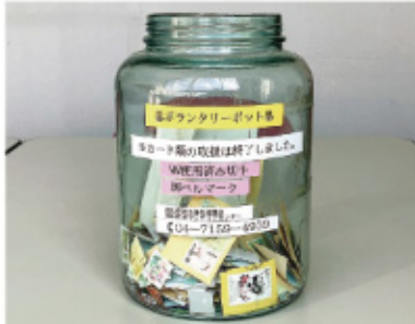
▲公共施設に置かれているボランティアポット

ったり、脳トレやゲームのお手伝い)の介護支援サポーター活動をしています。 コロナ禍で流山に移り住み、自宅にこもりがちで自粛生活の毎日でしたが、広報ながれやまで介護支援サポーターのことを知り、介護資格や傾聴ボランティア等で培ってきた長年の経験をフルに活用できるのは介護支援サポーターしかないと考え、現在に至っています。 施設の職員さんも利用者さんも、とても親切で居心地は最高です。 利用者さんから「楽しかった！また、来週お会いしましょうね。」と声をかけていただけることに喜びを噛み締めています。