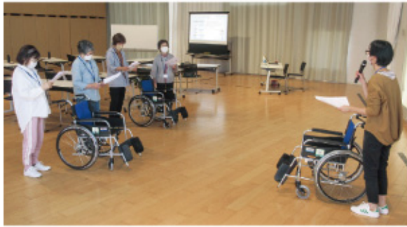
▲サポーター養成講座の様子