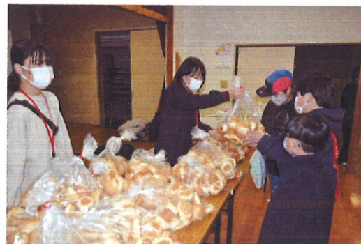
ひとりで食事する子供たちやその世帯を支援している子ども食堂へ支援金をお贈りしました。