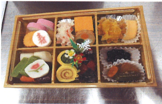
お一人暮らしの皆様が明るいお正月を迎えることができるようおせち料理を配食しました。

令和3年度歳末たすけあい募金総額 3,661,321円 ※使いみちは下段のグラフをご参照ください (募金総額と助成額の差額は、翌年度の募金とあわせ、地域福祉のために役立てられます)