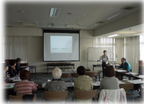
サポーター活動の心構え