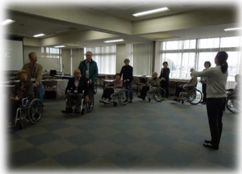
車いす操作法・試乗体験