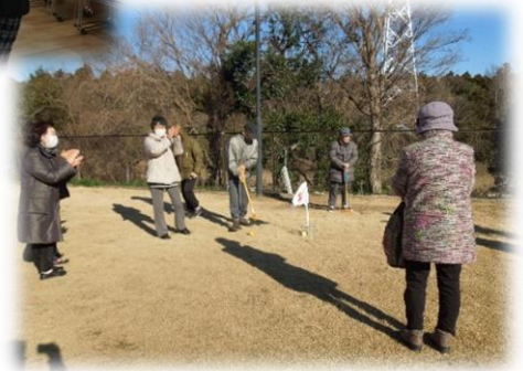
外でのレクリエーションなども見学