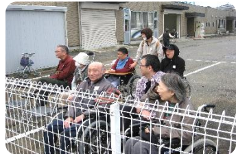
デイサービスの皆さん