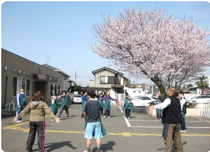
満開の桜の下で朝の体操（4月6日）