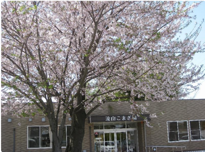
4月12日例年に比べ遅い満開でした