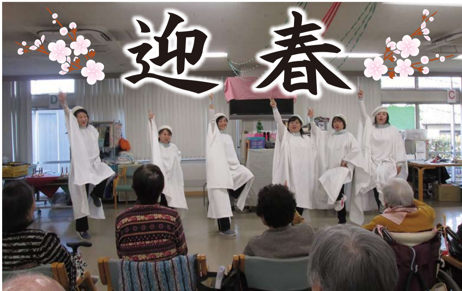
高齢者福祉の増進向上を目指し、指定管理者事業として運営している高齢者デイサービスセンター