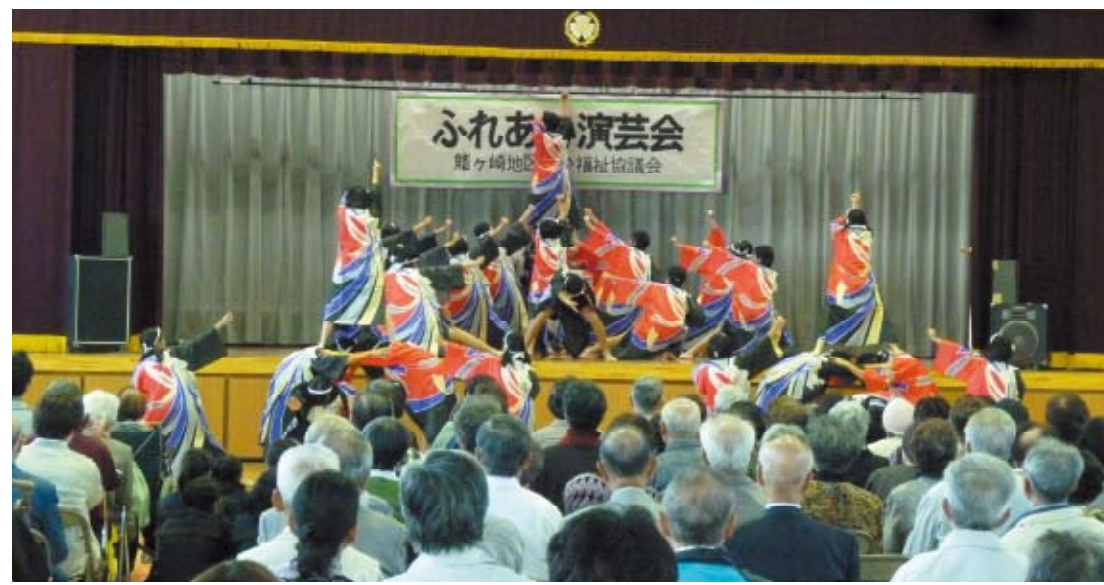
▲各地域で開催されている敬老事業（昨年の鯉ヶ崎地区社協主催のふれあい演芸会）

私たちの身の回りでは、社会的孤立、生活困窮、地域のつながりの希薄化、或いは虐待や権利擁護の問題等、様々な地域課題が深刻さを増してきています。このよつな中、流山市社会福祉協議会では、三年目を迎えました「流山市地域福祉活動計画」を基本に、地域住民はもとより、自治会や民生委員児童委員協議会、ボランティア団体等関係団体と連携協力し、地域福祉の推進と各種福祉サービスの提供に努めているところです。これらの活動は、皆様からお寄せいただいております会費で支えられています。会費は、社協の重要な自主財源であ